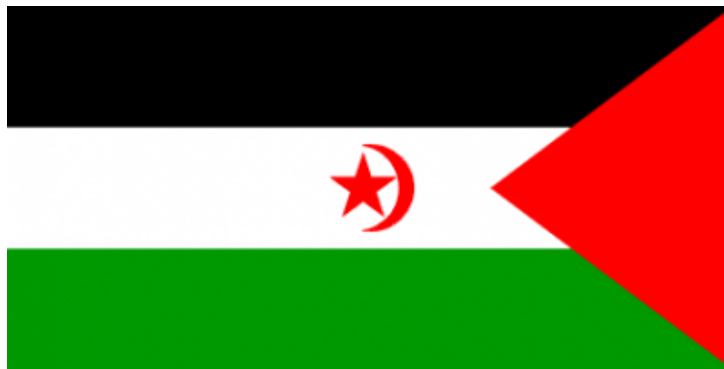
Drapeau du Sahara occidental

Même l'Onu avoue son impuissance à protéger ce peuple contre la terrible politique répressive des autorités marocaines. La complicité des puissances occidentales dans le massacre du peuple sahraoui est évidente. Le gouvernement Français est en première ligne dans le soutien à la politique coloniale du Maroc. Les États Unis y possèdent deux grandes bases militaires. (Sans commentaires).